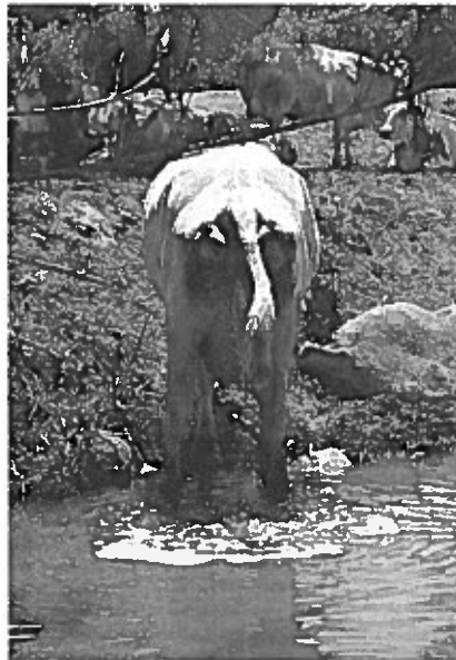
Foto 4 – Sversamento di deiezioni in alveo (in primo piano), area di stazionamento contigua al fiume (in fondo).